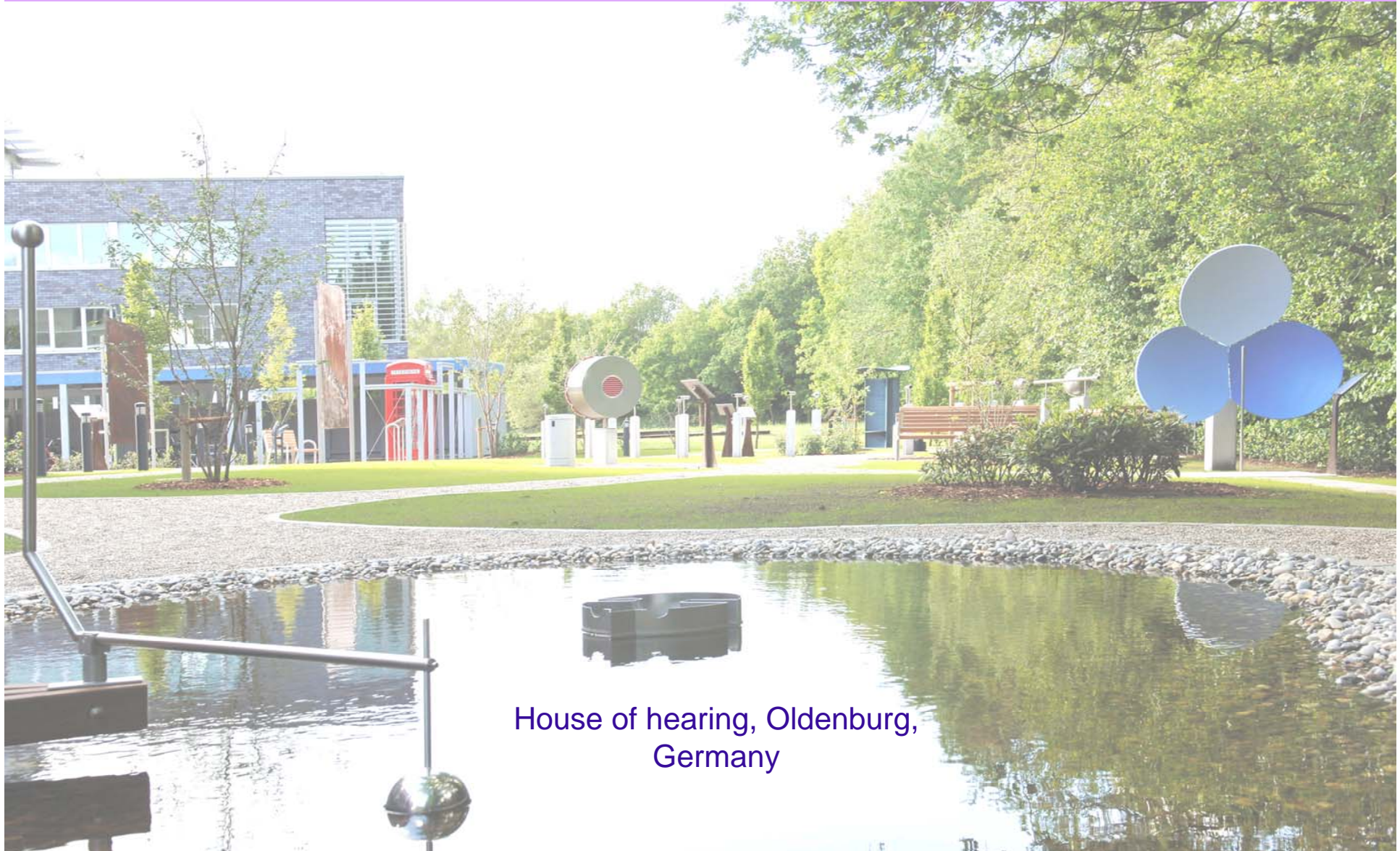
House of hearing, Oldenburg, Germany